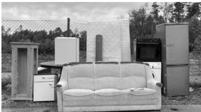
So sieht es aus, wenn der Sperrmüll richtig bereitgestellt wurde.

Entsorgungsfirma Knettenbrech + Gurdulic, Tel. 09321 9394-10, Mo – Mi + Fr 10.00 – 15.00 Uhr, Do 10.00 – 17.00 Uhr, oder Online unter www.kreis-nea.de oder über die Abfall-App des Landkreises.