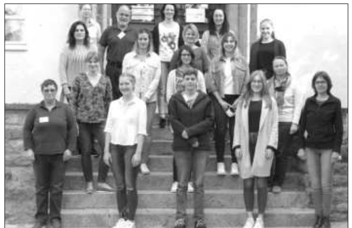
Bildunterschrift: Studierende der Hauswirtschaftsschule Uffenheim.

Studierende aufgenommen werden. Im Mittelpunkt der Fachschule stehen praktische Fertigkeiten und breites Fachwissen zur gesunden Ernährung sowie zum Familien- und Haushaltsmanagement. Der Studiengang stärkt die Persönlichkeit und fördert unternehmerisches Denken und Handeln. Er richtet sich an Frauen und Männer mit abgeschlossener Berufsausbildung außerhalb der Hauswirtschaft. Um Bildung, Beruf und Familie zu vereinen, findet der Unterricht in Teilzeitform statt. Der Schulbesuch ist kostenfrei. Weitere Informationen zur Hauswirtschaftsschule erhalten Sie unter www.aelf-fu.bayern.de .