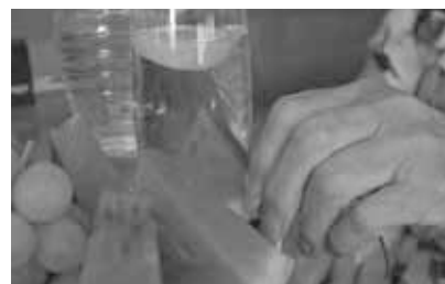
Melonen oder Gurken helfen, die erforderliche Flüssigkeitsmenge aufzunehmen.

Keine Frage, das Essen muss vor allem schmecken. Üppige, schwere Speisen belasten jedoch den Kreislauf zusätzlich. Leichte Alternativen zum beliebten Braten mit der dicken Soße sind zum Beispiel Kartoffeln mit Kräuterquark, gedünsteter Fisch mit Gemüse, ein bunter Sommersalat oder eine Mehlspeise mit Kompott.