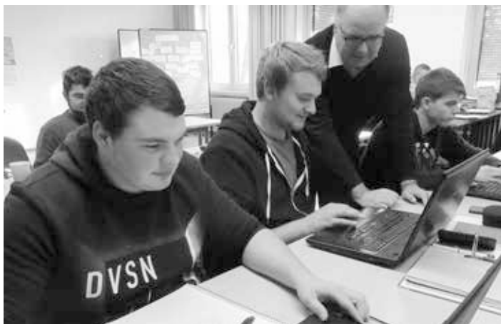
Studierende im Unterricht der Landwirtschaftsschule Abteilung Landwirtschaft

Zum Abschluss werden die geplanten Weiterbildungsangebote 2021/2022 des AELF Uffenheim mit Landwirtschaftsschule vorgestellt: